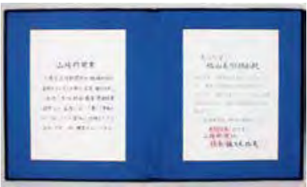
山陽新聞賞「文化功労」賞状