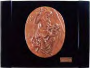
山陽新聞賞「文化功労」盾