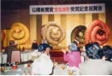
祝賀会アトラクション