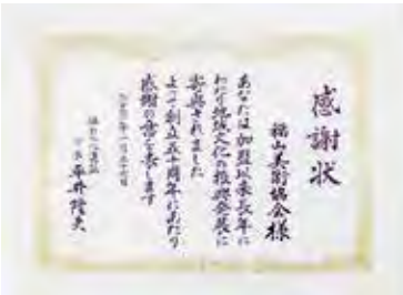
福山文化連盟感謝状