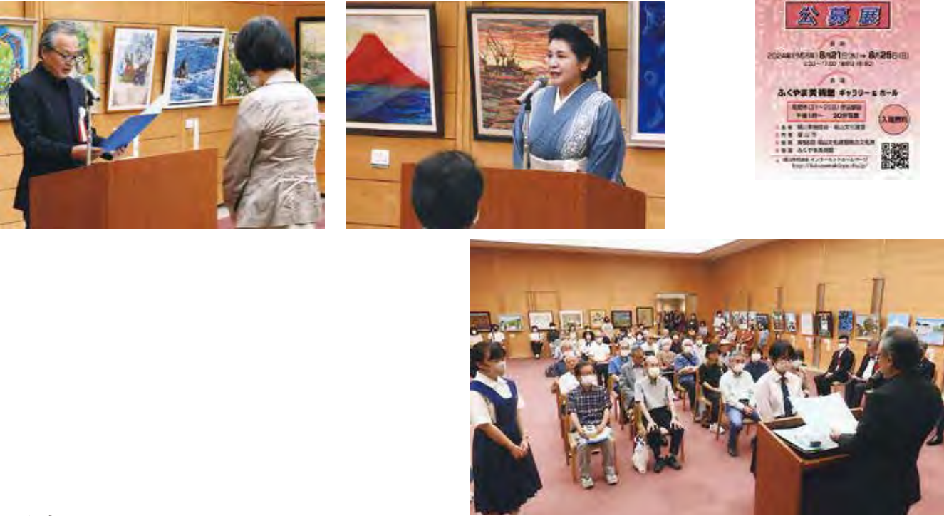
呉美術館見学及び周辺スケッチ